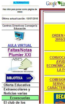
Plumier XXI. Ruta para introducir calificaciones

Zona de la web para entrar a "Faltas/Notas. Plumier XXI".